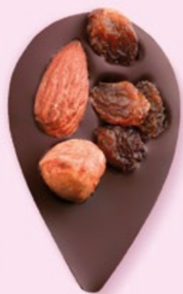
JULIETTE IN THE CITY Chocolat noir 60% de cacao, amande, noisette, raisins secs