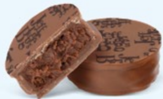
Ganache de chocolat noir au cacao fruité de Saint-Domingue, chocolat au lait 36% de cacao