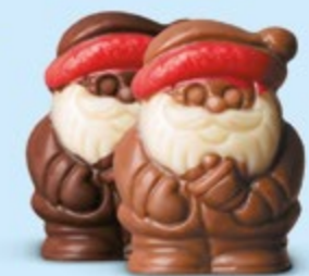
Duo praliné et caramel ou praliné et éclats de noisettes caramélisées