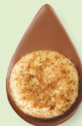
BISCUIT NOISETTES Chocolat au lait 35% de cacao

Un biscuit sablé artisanal posé sur un très bon chocolat ! C'est simple et c'est divin.