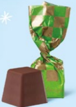
CHOCOLAT NOIR Praliné façon rocher aux éclats de noisettes