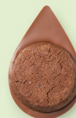
BISCUIT BROWNIE Chocolat au lait 35% de cacao

Les prix barrés sont les prix de vente TTC maximum en boutique. *Prix de vente TTC maximum.