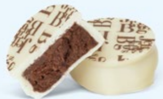
Puissante ganache de chocolat noir au cacao de Sao Tomé, chocolat blanc

BOITE DE 250 G NET 24 PALETS ASSORTIS 4 RECETTES