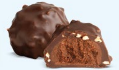
Praliné aux noisettes et éclats d'amandes, chocolat noir 60% de cacao