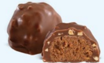
Praliné aux noisettes et éclats d'amandes, chocolat au lait 36% de cacao