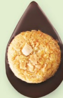
BISCUIT AMANDES Chocolat noir 60% de cacao