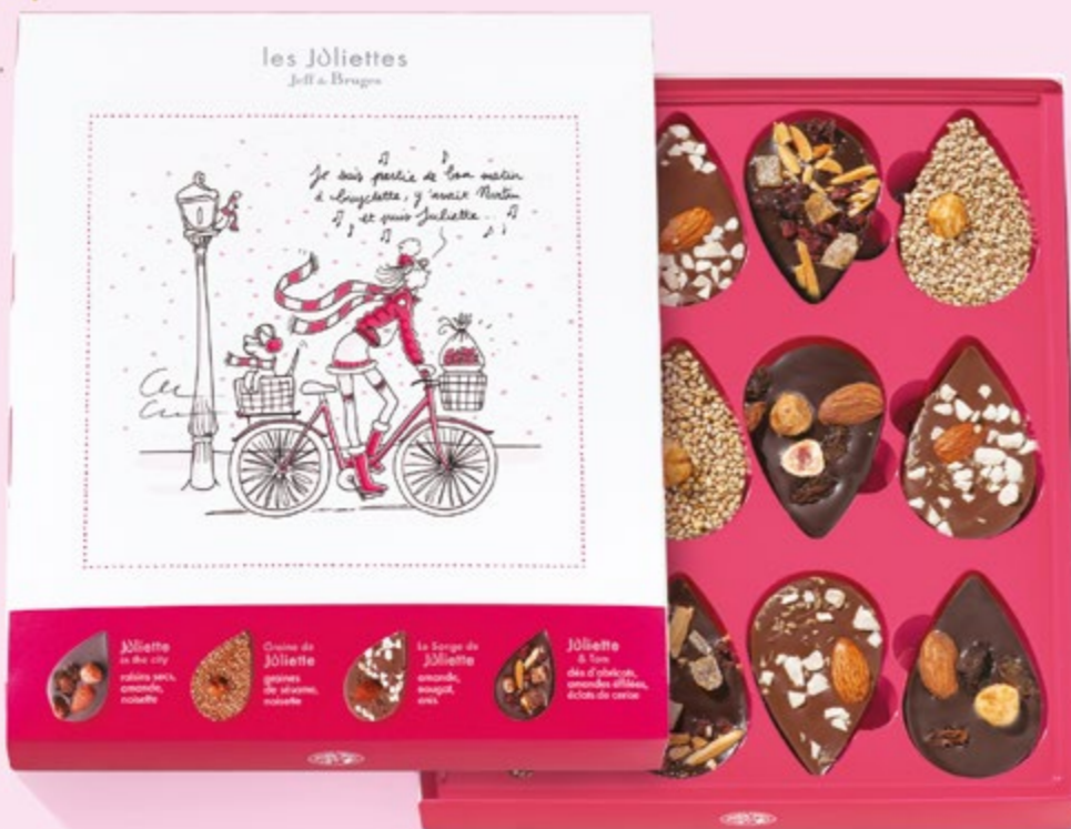
BOITE DE 285 G NET 26 JULIETTES ASSORTIES 4 RECETTES

Charmantes, élégantes et craquantes, les Juliettes s'invitent pour le dessert. Des saveurs surprenantes et tellement irrésistibles.