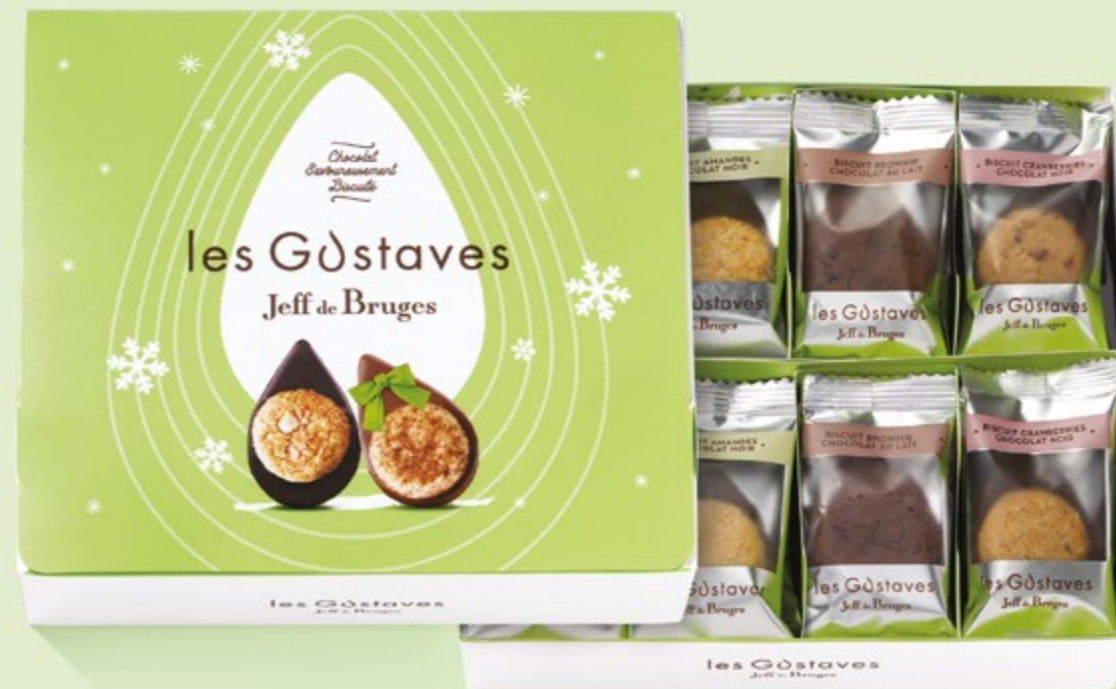
BOITE DE 325 G NET 24 GUSTAVES ASSORTIS 4 RECETTES