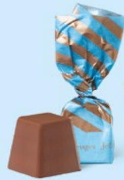
CHOCOLAT AU LAIT Praliné et sucre pétillant