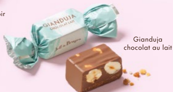
Gianduja chocolat au lait