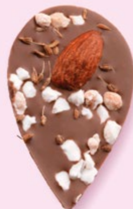
LE SONGE DE JULIETTE Chocolat au lait 35% de cacao, amande, éclats de nougat, brins d'anis