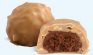
Praliné aux noisettes et éclats d'amandes, chocolat blanc caramélisé