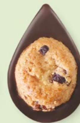
BISCUIT CRANBERRIES Chocolat noir 60% de cacao