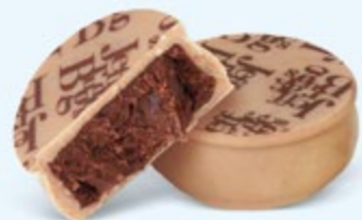
Ganache aromatique de chocolat noir au cacao d'Équateur, chocolat blanc caramélisé