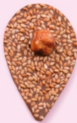
GRAINE DE JULIETTE Chocolat au lait 35% de cacao, sésame, noisette caramélisée