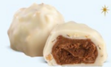
Praliné aux amandes et éclats d'amandes, chocolat blanc