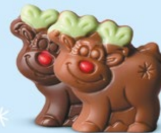
Praliné et éclats de noisettes torrifiées ou praliné et éclats de crêpe dentelle