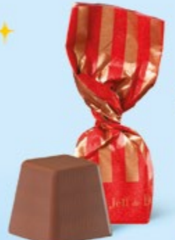
CHOCOLAT AU LAIT Praliné noisettes façon pâte à tartiner