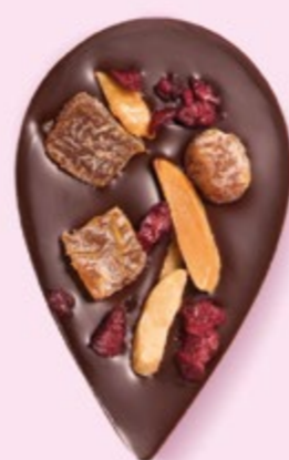
JULIETTE & TOM Chocolat noir 60% de cacao, dés d'abricots secs, amandes caramélisées et morceaux de cerise