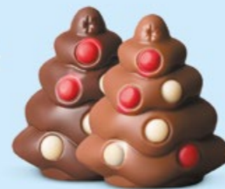
Praliné et sucre pétillant ou praliné et éclats de nougat

Nos choco'pralinés font partie de la magie de Noël. Ils plaisent aux petits... comme aux grands !