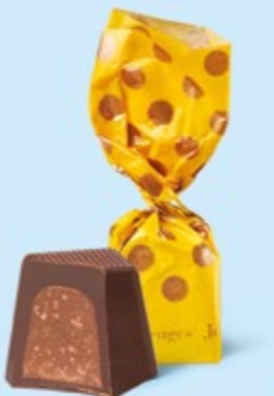
CHOCOLAT NOIR Praliné avec éclats de crêpe dentelle

BOITE DE 245 G NET 19 SUJETS ASSORTIS AU PRALINÉ 7 RECETTES