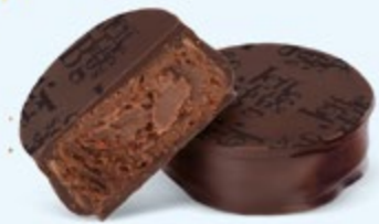
Ganache corsée de chocolat noir au cacao du Venezuela, chocolat noir 70% de cacao

Venezuela, Saint-Domingue, Équateur, Sao Tomé... Une invitation au voyage vers les plus fameuses origines de cacao.